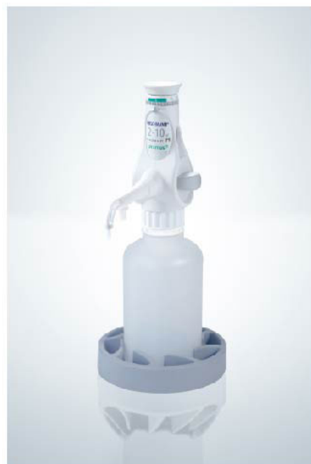
氢氟酸瓶口分配器